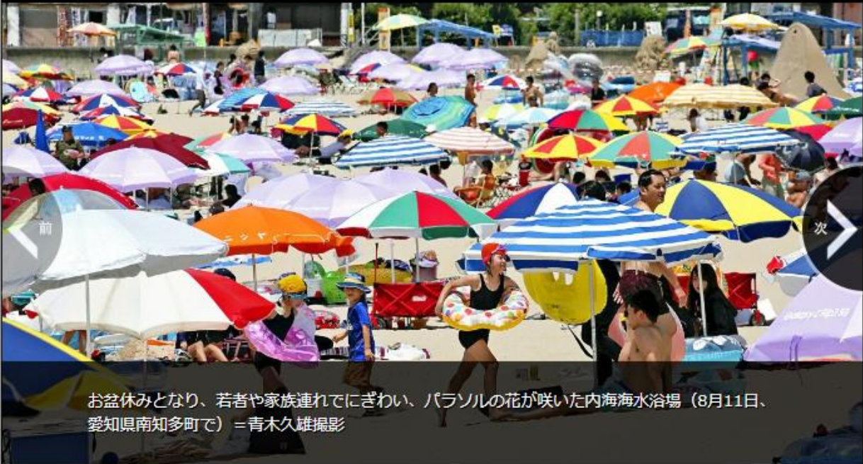
お盆休みとなり、若者や家族連れでにぎわい、パラソルの花が咲いた内海海水浴場（8月11日、愛知県南知多町で）