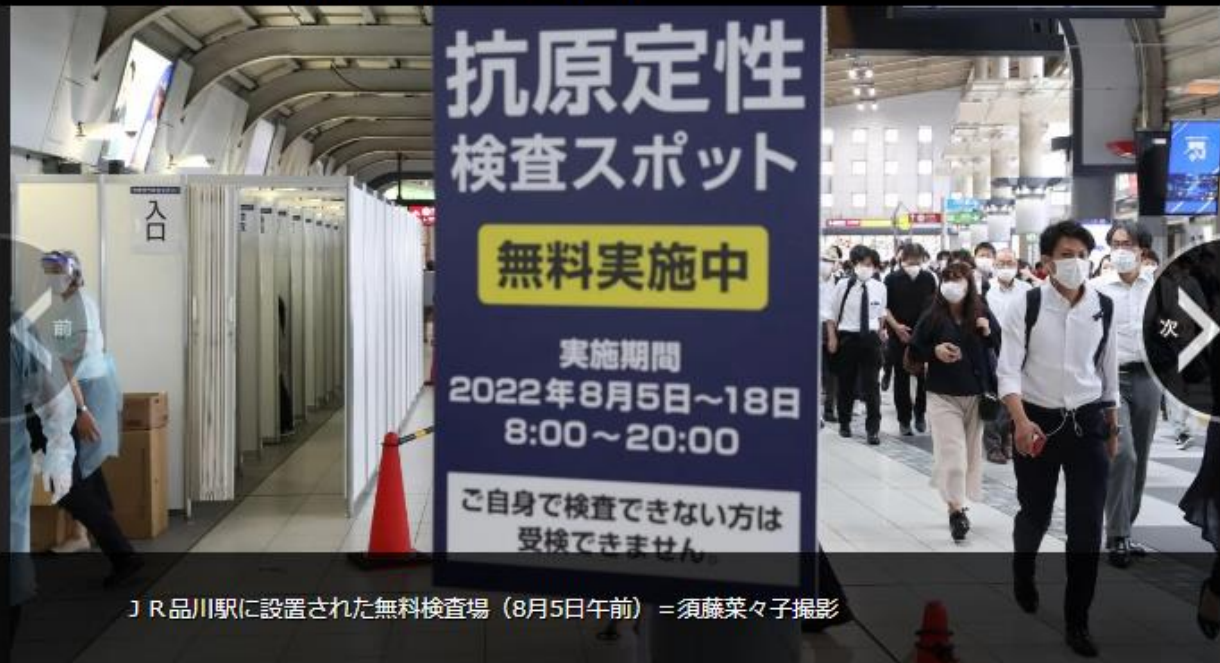
JR品川駅に設置された無料検査場（8月5日午前）