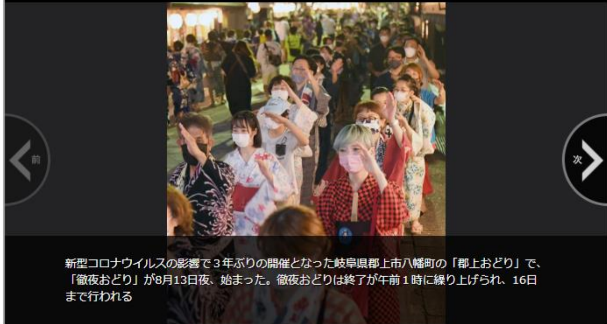
新型コロナウイルスの影響で3年ぶりの開催となった岐阜県郡上市八幡町の「郡上おどり」で、「徹夜おどり」が8月13日夜、始まった。徹夜おどりは終了が午前1時に繰り上げられ、16日まで行われる