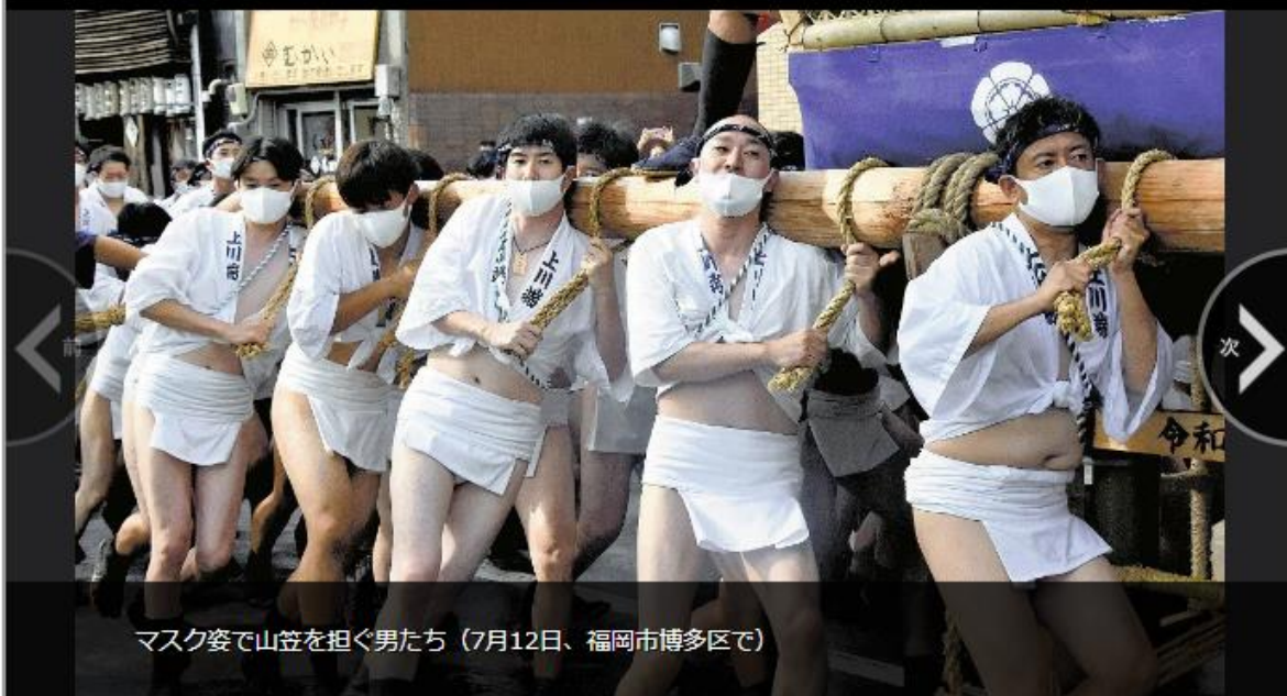
マスク姿で山笠を担ぐ男たち（7月12日、福岡市博多区で）