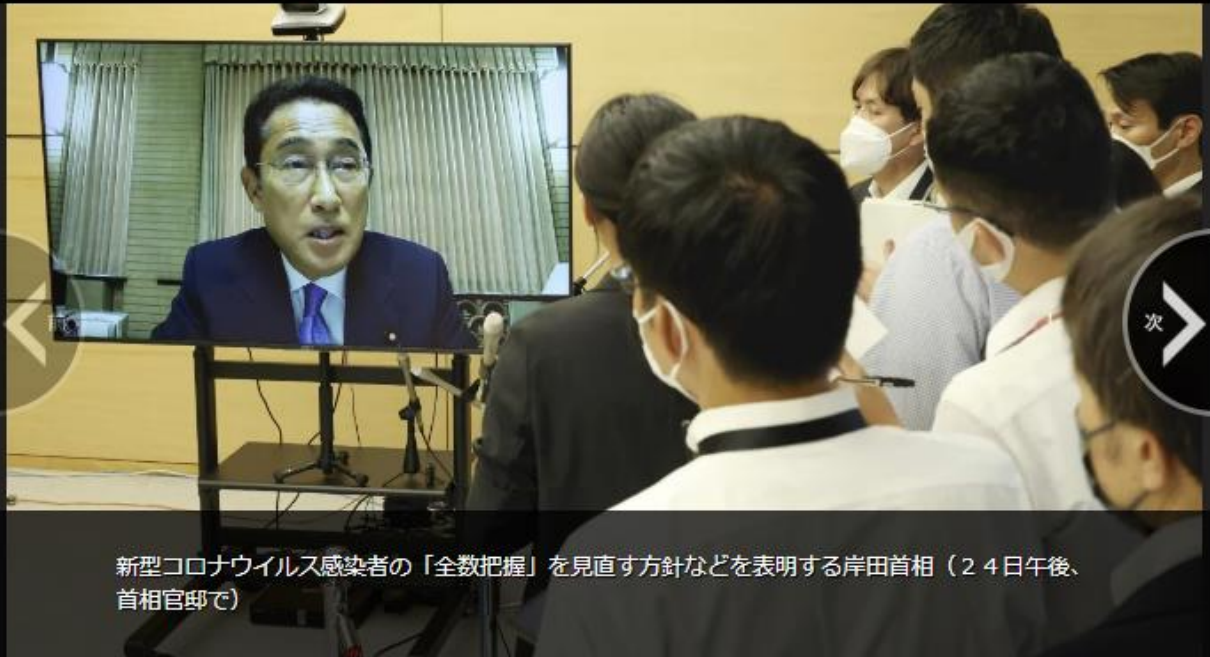
新型コロナウイルス感染者の「全数把握」を見直す方針などを表明する岸田首相（24日午後、首相官邸で）