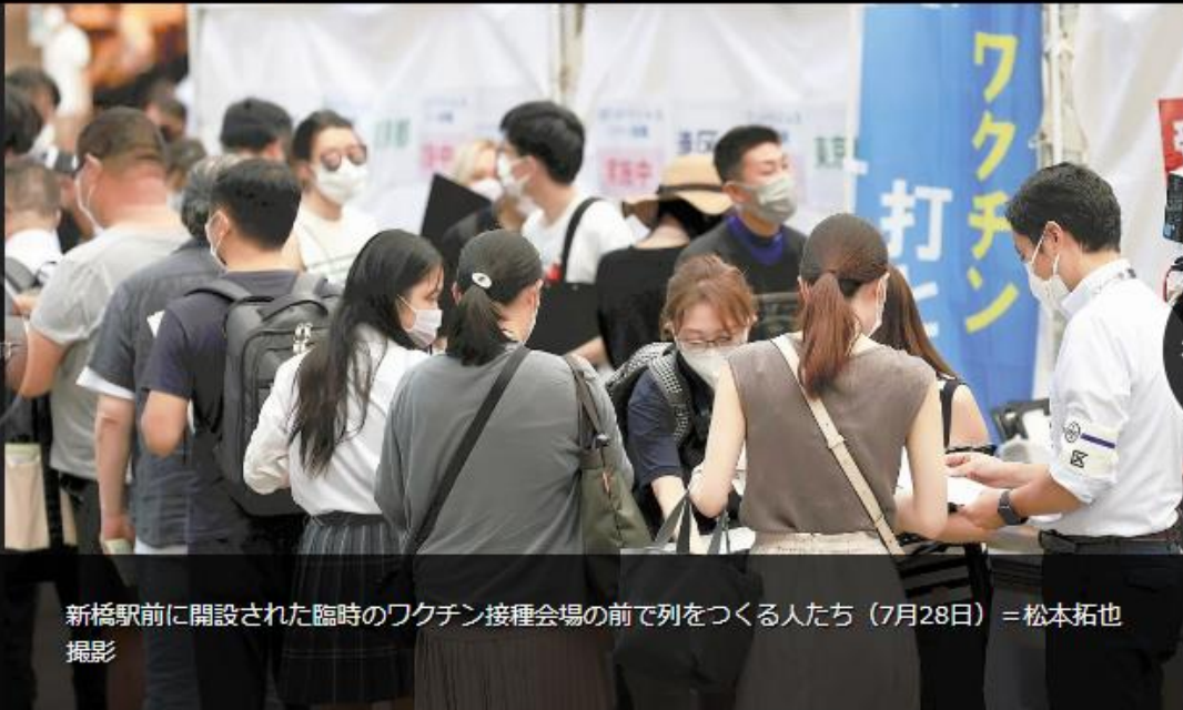
新橋駅前に開設された臨時のワクチン接種会場の前で列をつくる人たち（7月28日）