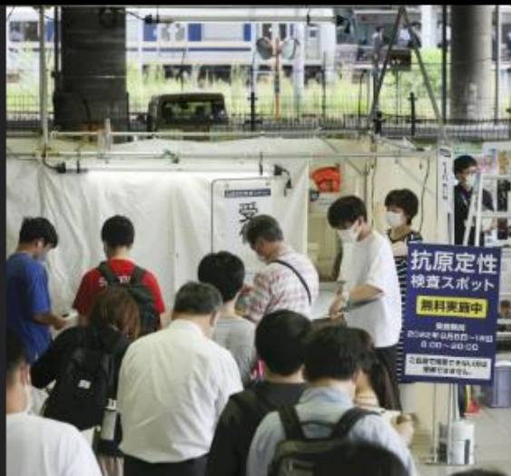
お盆休みを前に設置された新型コロナの無料検査場（8月5日午前、JR新大阪駅で）