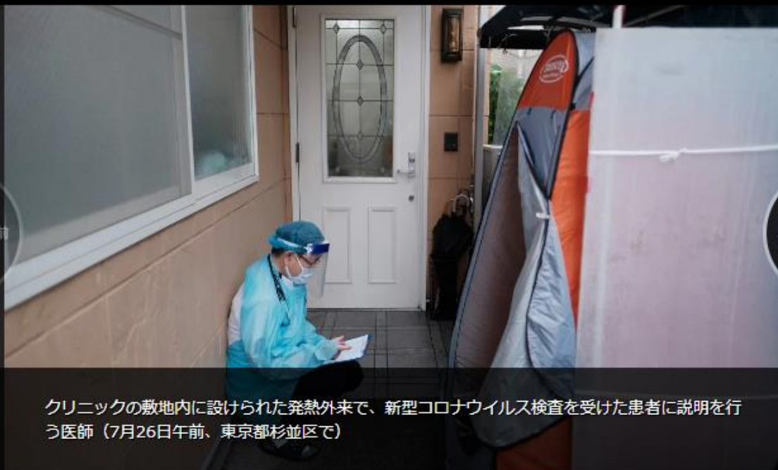
クリニックの敷地内に設けられた発熱外来で、新型コロナウイルス検査を受けた患者に説明を行う医師（7月26日午前、東京都杉並区で）