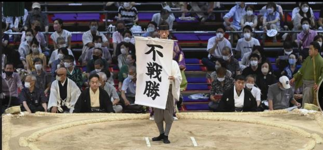
名古屋場所11日目もコロナ関連で休場が相次ぎ、土俵上には「不戦勝」の垂れ幕が掲げられた (7月20日)