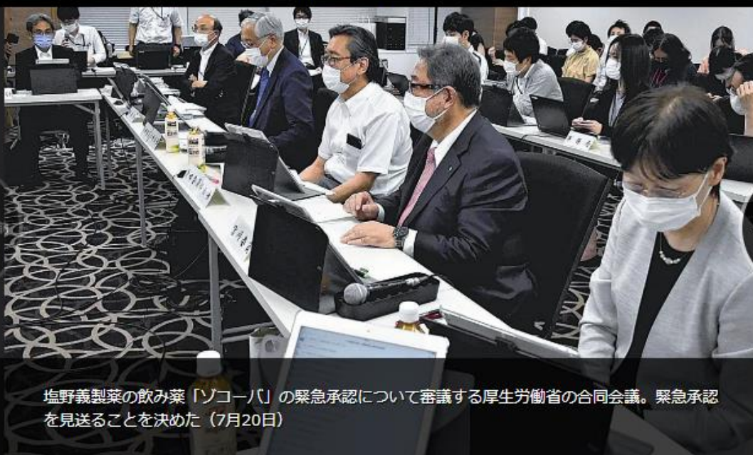
塩野義製薬の飲み薬「ソコーバ」の緊急承認について審議する厚生労働省の合同会議。緊急承認 を見送ることを決めた (7月20日)