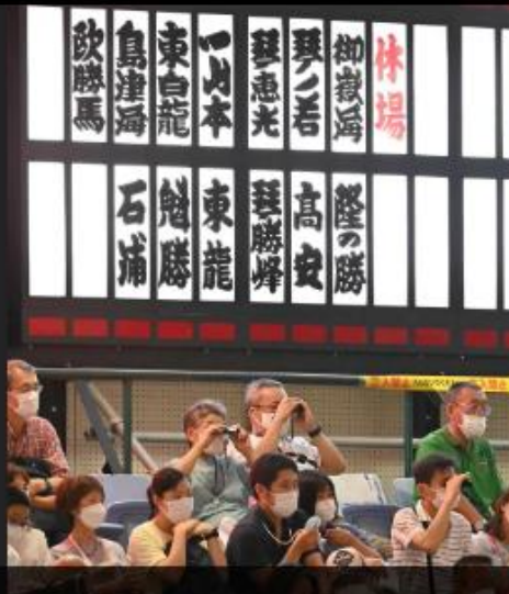
新型コロナウイルスのために休場する力士が目立つ大相撲名古屋場所（7月22日、名古屋市中区の愛知県体育館で）