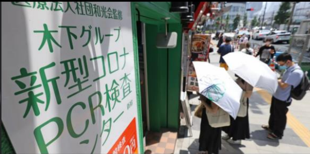
厳しい暑さの中、日傘を差して新型コロナ検査の順番を待つ人たち（7月23日午前、東京都新宿区で）