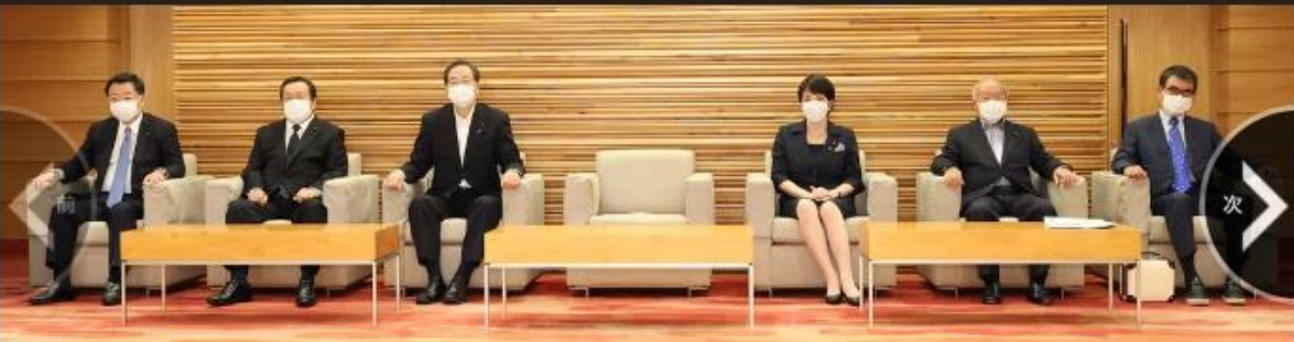
閣議に臨む松野官房長官（左端）ら。新型コロナウイルスに感染し隔離中で、オンラインで臨む岸田首相の席（中央）は空席となっている（26日午前、首相官邸で）