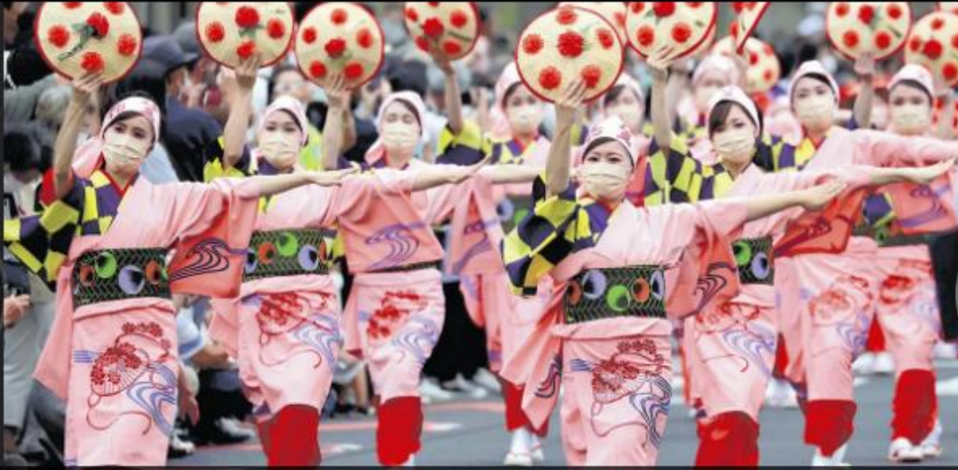
山形を代表する夏祭り「山形花笠まつり」が8月5日、山形市で始まった。新型コロナウイルス禍の影響で、市中心部でのパレード形式による開催は3年ぶり