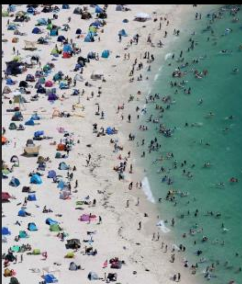
多くの人でにぎわう白良浜海水浴場（7月23日午後、和歌山県白浜町で、読売ヘリから）