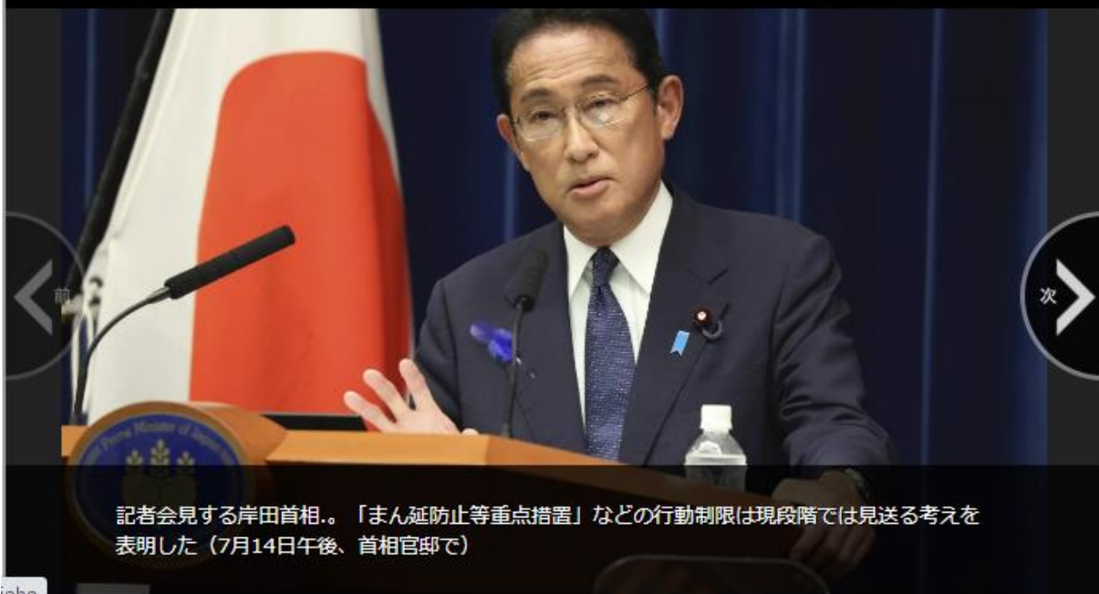
記者会見する岸田首相。「まん延防止等重点措置」などの行動制限は現段階では見送る考えを表明した（7月14日午後、首相官邸で）