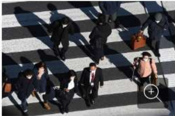
マスク姿で横断歩道を渡る人たち = 東京都千代田区で2021年2月5日

毎日新聞と社会調査研究センターは21日、全国世論調査を実施した。新型コロナウイルス対策として、外出時にマスクを着用することについて尋ねたところ、