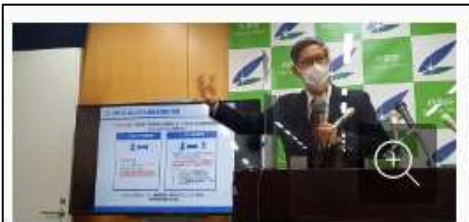
記者会見する政府の新型コロナウイルス感染症対策分科会の尾身茂会長＝東京都千代田区で 2022年3月11日午後2時10分

先月 27 日に開かれた政府の新型コロナウイルス感染症対策分科会で、専門家は今後の対策として、現在流行しているオミクロン株へのワクチンの有効性を回復するために 3 回目の接種を着実に進めることが必要だと強調した。コロナにかかると、若い人でも重症化や後遺症が見られる場合もあるとし、「重症化リスクの高い高齢者だけでなく、若年者も自らの健康を守るために接種していただくことが求められる」と呼びかけた。そのための情報提供の進め方として、「ワクチン接種者では症状が遷延（せんえん）する（長引く）リスクが