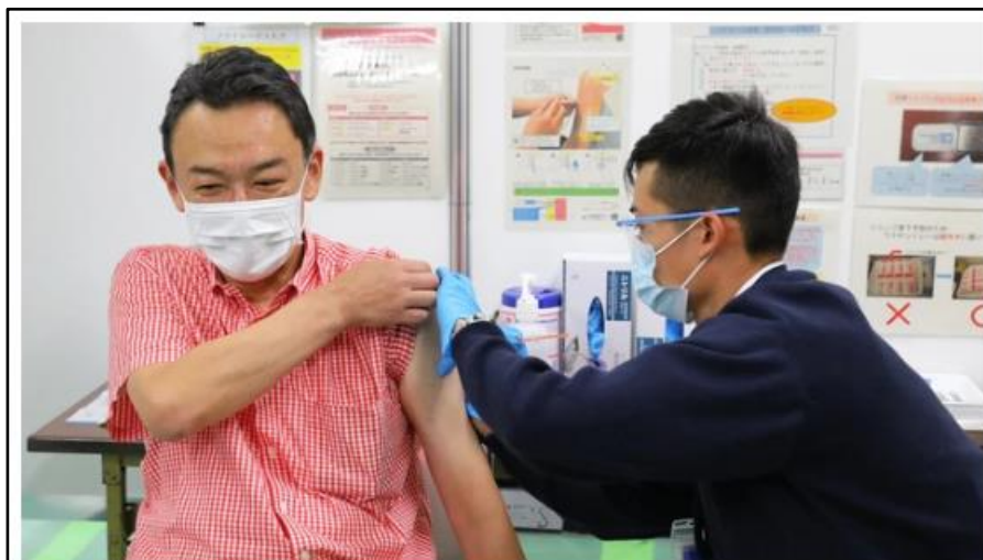
大規模接種会場でオミクロン株対応ワクチンの接種を受ける男性＝東京都千代田区で 2022年10月3日

新型コロナウイルスの感染第7波は下げ止まり、再び上昇傾向を見せている。先行して流行が拡大した欧州の様子も考え合わせると、人々の動きが活発になる年末年始に向け第8波がやってくるのは避けられないというのが大方の専門家の見方だ。