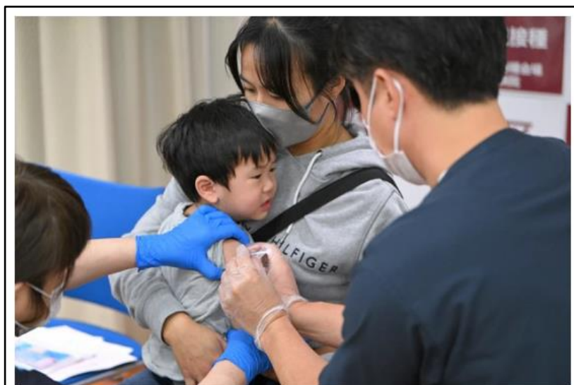
ワクチンの接種を受ける幼児＝東京都港区で2022年10月25日