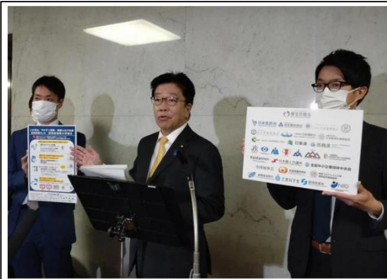
新型コロナとインフルエンザの同時流行に備えた対応を呼びかける加藤勝信厚生労働相（中央）＝衆院分館で2022年10月28日

これから、インフルエンザなどコロナ以外の呼吸器感染症もはやる季節。今、重要なのは「脱マスク」などではなく、十分なリスク評価と備えだと思う。