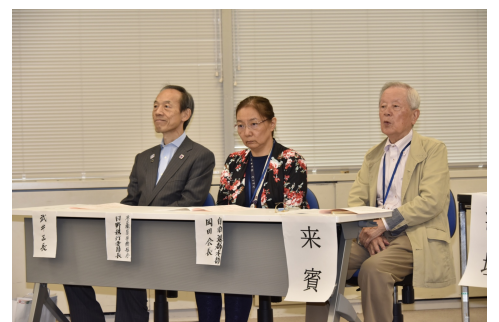
ご来賓のみなさん

会長及び事務局長から、「価値観の変化もあり、入会会員数は減少傾向にあるが、入会への働きかけに努力している。また、先輩の