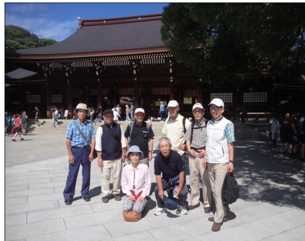
第26回千葉県クラブ 「宗吾廟堂と 佐倉惣五郎旧宅を 訪ねて」 宮崎武雄

生したのは明治39年。皇室の庭園として造られたが、戦後、国民公園となり、親しまれてきた。見るところが沢山あった。最後に甲州街道に出て四谷大木戸跡を訪ねて終わった。