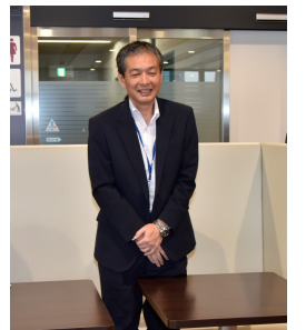
こくみん共済coop 中南部支所長 様