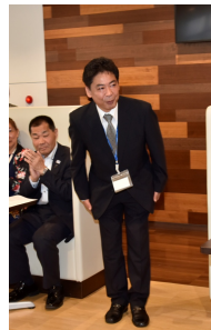
(株)セレモア 担当部長 様