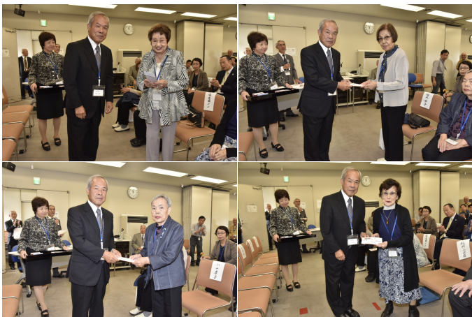
長寿の祝い 米寿のみなさん

ございます。また会うことを楽しみに一日一日大事に過ごします。今日ありがとうございます。