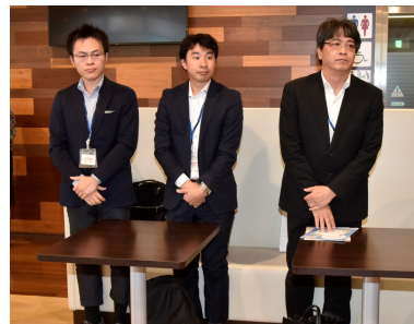
中央労働金庫のみなさん