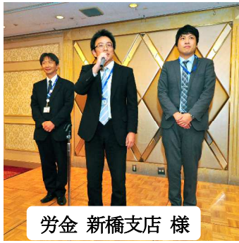
労金 新橋支店 様