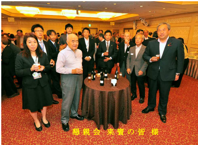
懇親会 来賓の皆様