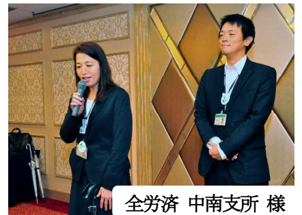
全労済 中南支所 様